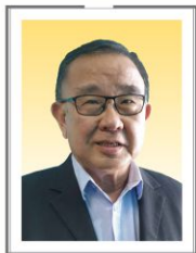
副主席 拿督黄天隆