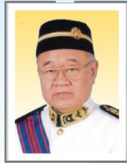
主席 丹斯里拿督斯里林玉唐